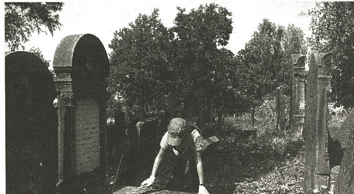
Każdą macewę należało oczyścić z mchu.

o czym warto pamiętać – tworzyli ją wspólnie z radomszczanami. To głównie zasługa tych młodych ludzi. – To, co robi ta młodzież, którą tutaj spotykam to wielkie dzieło. Ja ją bardzo kocham. To trzecie pokolenie sprawiedliwych wśród narodów świata. Oni dają nadzieję na lepsze jutro – to fragment przemówienia ambasadora Izraela w Polsce, Shewacha Weissa, które wygłosił podczas II Sejmiku Radomszczańskiej Kultury.