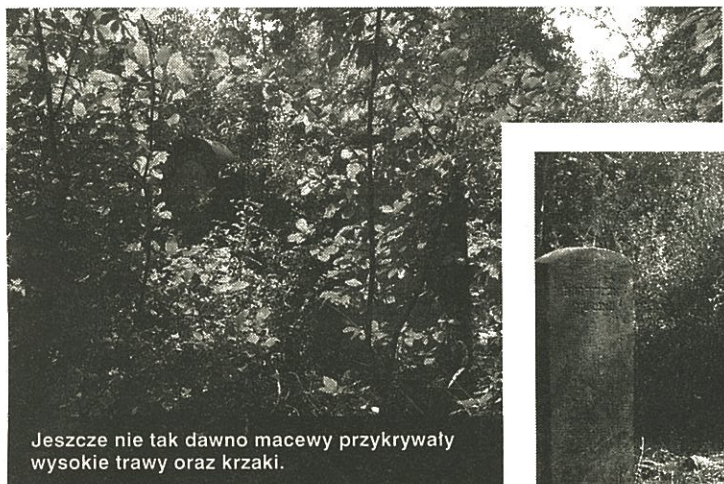
Jeszcze nie tak dawno macewy przykrywały wysokie trawy oraz krzaki.

– Dla nas jest to cudownie spędzony czas. Codziennie bardziej zagłębiamy się w tajniki kultury żydowskiej. Odkrywamy w niej coś in-