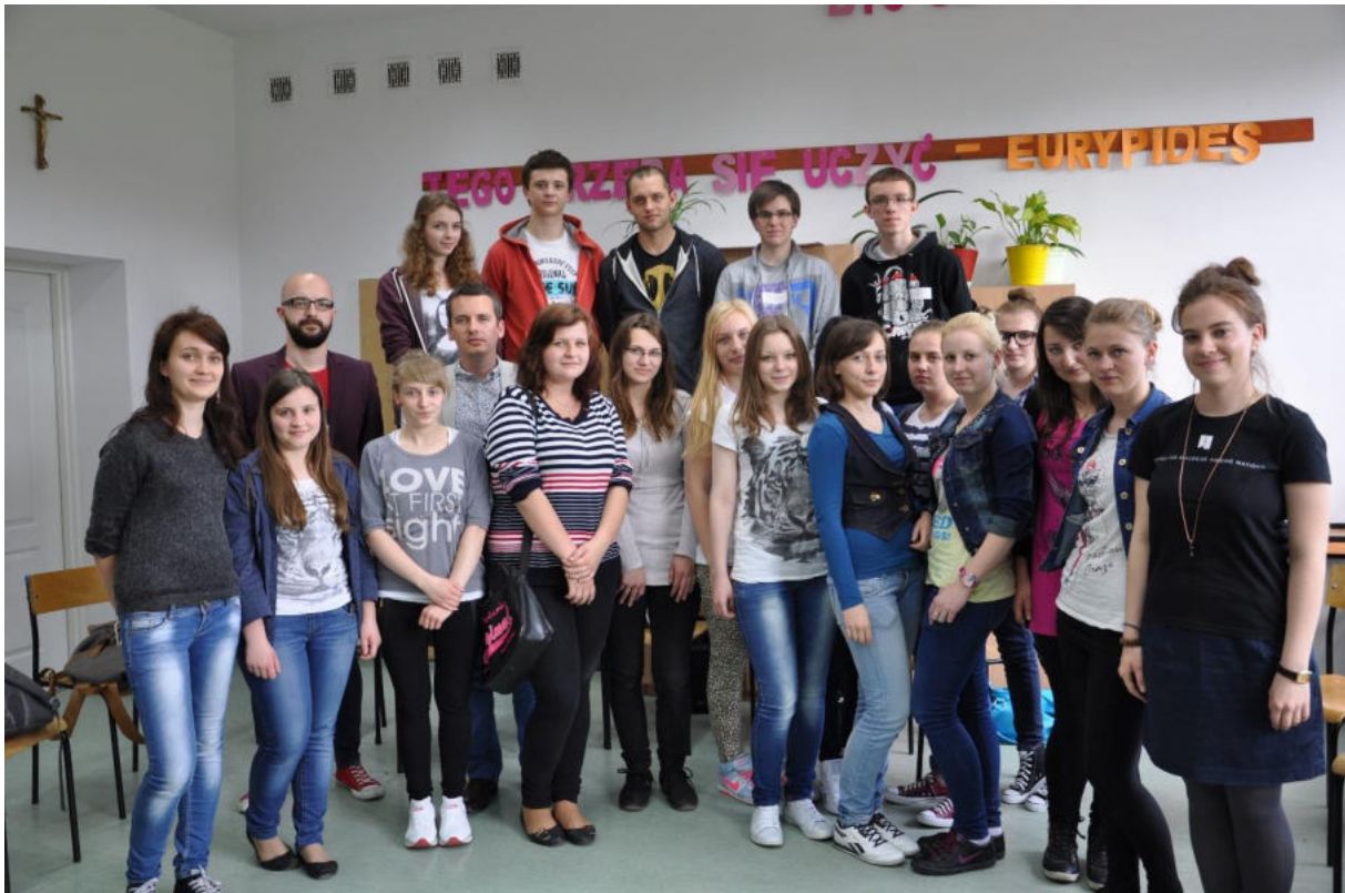
Uczestnicy warsztatów Szkoły Dialogu w Zagórowie