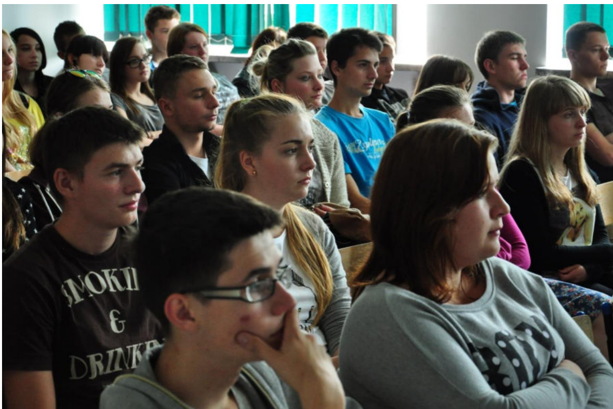
Premiera filmu.

W dokumencie wykorzystano fragmenty następujących filmów: Rodzina Kowalskich , reż. Arkadiusz Gołębiewski, Maciej Pawlicki, 2009; Oczy szeroko otwarte , reż. Haim Tabakman, 2010; Ambulans , reż. Janusz Morgenstern 1961.